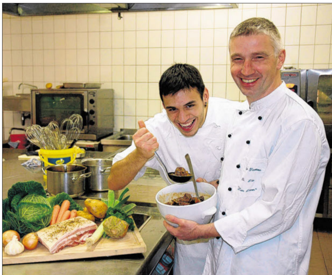
Für die aktuellen kulinarischen Aktionswochen haben sich die Köche der Odenwald-Gasthäuser wie hier im „Löwen“ im Brombachtal einiges einfallen lassen.

Das Odenwald-Gasthaus „ Müm-lingstube “ in Erbach bietet einen feurigen Hackfleisch-eintopf mit Odenwälder Rindfleisch, Mais, roten Bohnen und Kartoffeln bzw. mit Leberwurst gefüllte Balleklöß auf Rahmsauerkraut an, zu denen jeweils hausgebackenes Brot serviert wird.